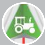
Software de AgNav Interface amigável e intuitiva.