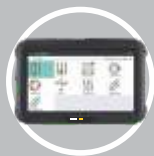
Monitor Robusto, para um ambiente de trabalho pesado.