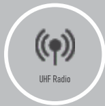
Rádio UHF Módulo de rádio UHF padrão embutido.