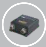
PLC ECU Controlador da válvula de direção, PWM ou CANBUS.