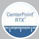
Trimble RTX™ Maior precisão com correções via satélite Trimble RTX®