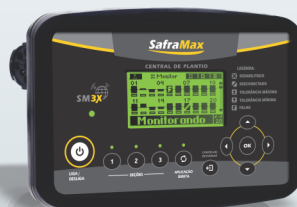
MONITOR DE PLANTIO SM3X