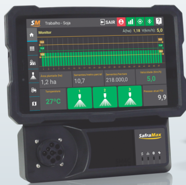
MONITOR DE PLANTIO SM4C

*Estas especificações podem ser alteradas sem aviso prévio.